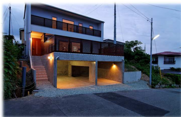
H26年度 住宅のゼロエネルギー化推進事業採択

太陽光発電システム: CIS太陽電池 4.08kW 熱損失係数Q値: 0.83W/㎡・K